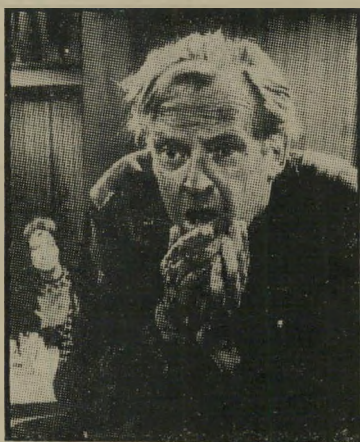
ארתור קנדי ב"סתיו אפאלאצי" תקוות שוא

סרט טלוויזיה (יום ד' 29/12, 20.40) סתיו אפאלאצי — דרמה רגישה על משפחה נצרכת בעיר שדה אמריקנית התולה תקוות שוא בהצלחתו האמנותית של הבן הוג, שגילה כשרון גדיר בעבודות קראמיקה, לאהר שכל המשפחה נרתמת לאיסוף כספים על מנת לממן את השתלמו תו בתחום זה, מתנפץ החלום לרסיסים.