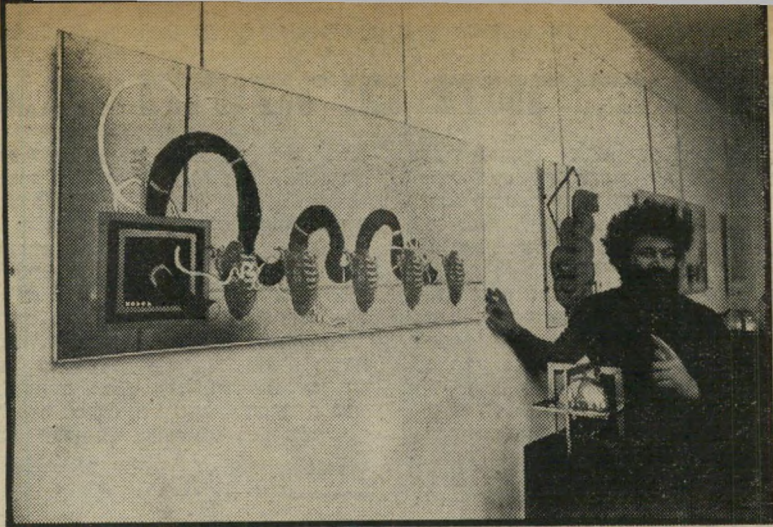
ציור שמואלי ויצירת הפגנה נגד מטורפייהדת

קרוב, אם לא תיפסק השתוללות הדתיים הקיצוניים.