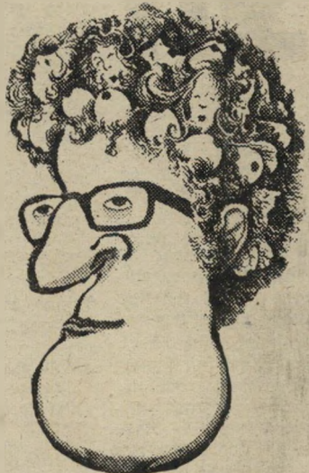
בק (שד אפדייק) האלו, באלו

(המשך מעמוד 10) כך הוא אופייני לבני-מינו — ברח מן הדת, אבל לא מן היהדות; נשאר רווק, אבל לא שכת את אמו, שתחת שיכטה גדל; סובל מכל תסביכי גיל הארבעים, כשהזיקנה והמוות מציצים מעבר לאופק, הבדידות הופכת מפריבילגיה לעונש, ושע