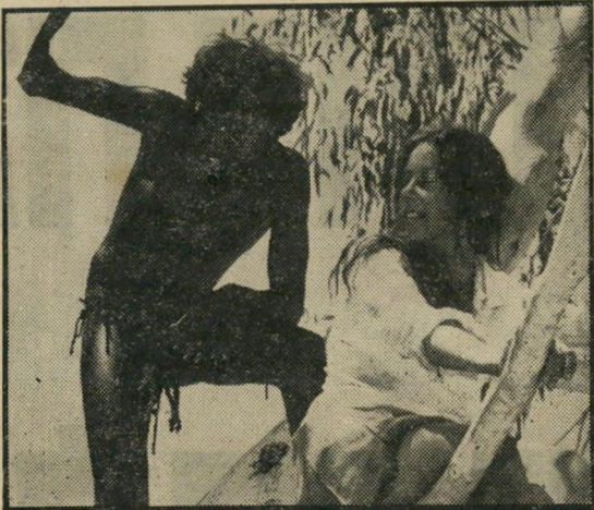
אגוטר וגומפיליל: חזרה לעצים

הרבה דברים אינם קורים במשך כל הסרט הזה. זהו בעיקר סרטו של צלם, (הבמאי ניקולאס ריי היה בעבר צלם מהולל, שעבד עם לוסי וטריופ) המנציח את אלפי הפנים של הערבה האוסטרלית, ותוך כדי כך עורך הש'ט וואות אינסופיות בין החיים בחיק הטבע, עם הפרמיטי'טיביות שבהם, לבין הקירות האטומים והמחניקים של העיר הגדולה. הסרט מלא וגדוש רמוזים מיניים, שהם הרי חלק בלתי-נפרד מן הטבע, ויש בו כמה התקפות חזיות על האדם המודרני, למשל בדמות רוצחי חיות