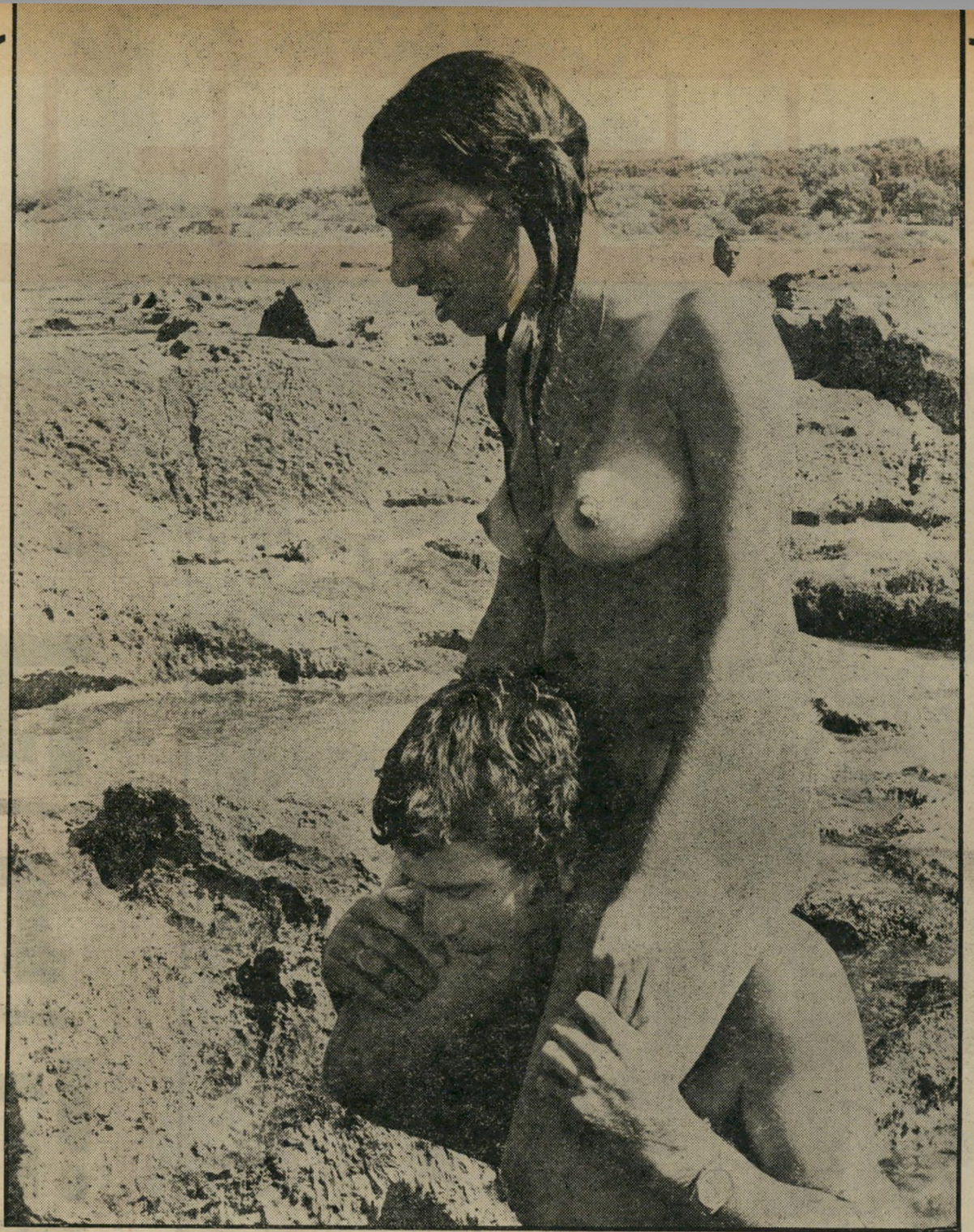
- הנערה לומדת רכיבה על כתפי הצבד החסון - חוזרת לשבע -

שתי המדינות יהיו תחנות במסעו של סאדאת — אל מוסקבה.