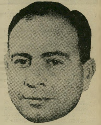
מוחייאל-דין מעצר או ועידה?

השאלה היא: האם אין מצריים נסחבת, בעל כורחה, לדרך המובילה למלחמה? בשביל הנאומים? אל-סאדאת הבריטי כי שנת 1971 תהיה, שנת ההכרעה. בסוף שנה זו, כך הכריז לא פעם, יהיה צורך לבחור בין מלחמה ושלו. תחילה נשמעו הדברים כאיום דיפלומטי, המכוון נגד האו"ם וארצות-הברית. לאמור: המצב הנוכחי של כיבוש ישראלי, וסחבת אמריקאית-ישראלית, אינו יכול להימשך לנצח. יש גבול של זמן: 31.12.71. הכוונה היתה ללחץ על גופים אלה, ולצורך זה ננאמו נאומים בחריפות גוררת. עדיין היה ברור כי מטרת הלחץ אינה אלא להגיע לשלום, בדרך של כפייה אמריקאית על ממשלת גולדה מאיר. אולם בעבר קרה לא פעם שהמילים הערביות גררו אחריהן מעשים ערביים.