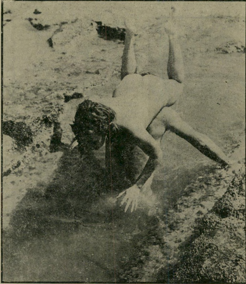
חירת אמריקאית וצעיד ישראלי יצאו לפיקניק -