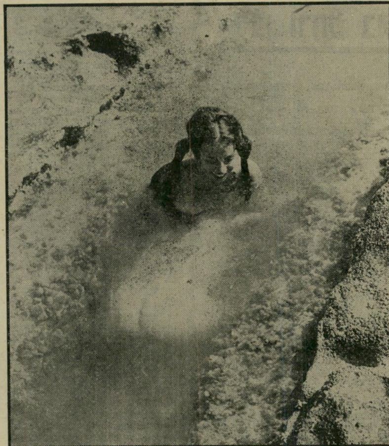
- אסיירת בין הסלעים