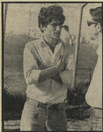
שחקן שוריק "רוצים אותי ב־40 אלף!"

"עכשיו כולם נגדנו, למרות שאף בית משפט לא מצא אותנו עדיין אשמים. כר' לם נגדנו. הטלוויזיה מראינת את האויי' בים שלנו ואת טענותינו מסרבים לשמוע. אנהנו פרובינציה ולכן זה נוח לדפוק קבוצה כמו שלנו, כדי שמישהו יהיה קור' בן לשחיתות של הכדורגל הישראלי."