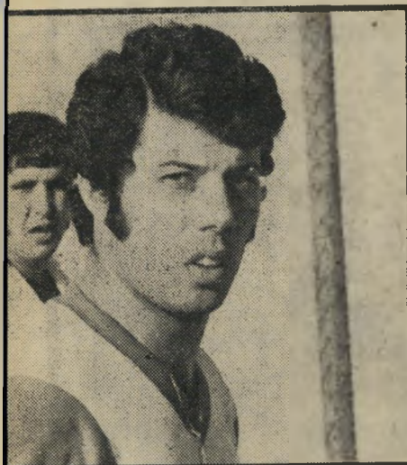
שחקן ארזי "נשלם לעורכי-הדין!"

ה פועל חדרה היה ומתגוררת ה בחדרה, בינתיים. בינתיים היא אפילו משחקת כדורגל, כמו שאירע ב' מוצאי-חג הסוכות השבוע. אבל מצב זה הוא זמני בהחלט. לדעת מרבית כדורגלני הקבוצה ואוהדיה.