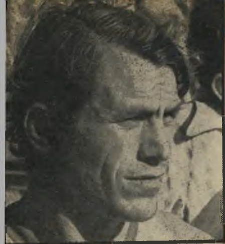
שחקן ארצי "הפועל" הפקירה אותנו!