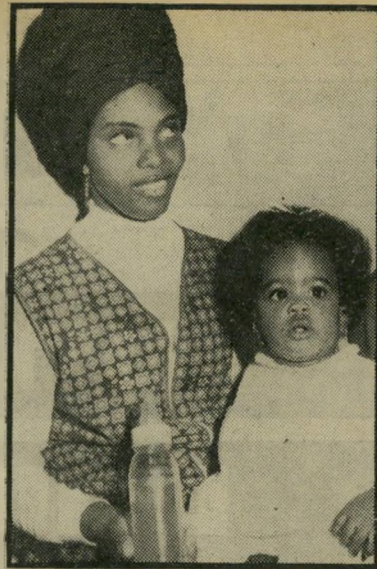
צפיה לגירוש שיבנה מורבת שבעת החודשים, שנולדה בבית-החולים המרכזי בבאר-שבע, ונרשמה כיהודיה.