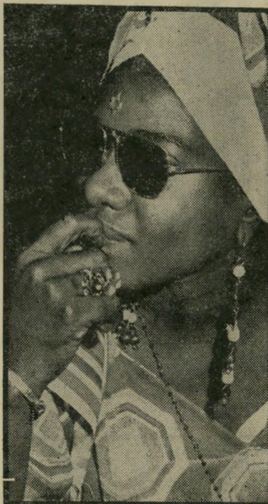
גורשה אשתו של ראש קבר צת העברים הישראליים. בין שאר התכשיטים שעטרו את גופה, בלט במיוחד מגן-דוד מזהב.