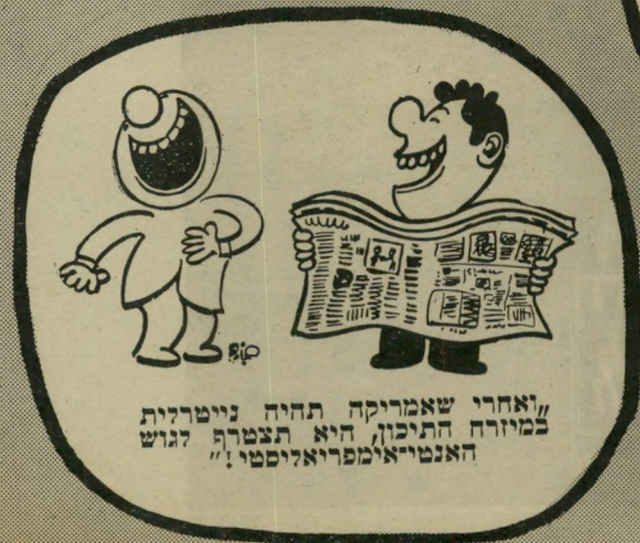
"ואחריו שאמריקה תהיה נייטרלית במיזרח התיכון, היא תצטרף לגוש האנטי-אימפריאליסטי!"