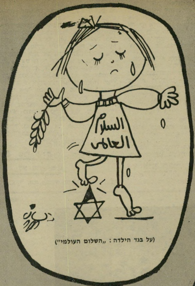
(על בגד הילדה: "השלום העולמי")

הקאריקטורה היא מכשיר פוליטי ממדרגה ראשונה. משום כך יש תמיד עניין בניתוח הקאריקטורות המתפרסמות בארצות-ערב על ישראל. ועניין מיוחד בציוריו של השבועון "רוז אל-יוסוף", המיצרי, שהוא אלוף הקאריקטורות בעולם הערבי. בימי השיא של הסיכסוך הישראלי-ערבי, תיאר השבועון את ישראל בדמות האנטי-שמית הידועה של היהודי, החומס והשודד. והנה, בזמן האחרון, השתנתה הדמות. הצורה האנטי-שמית נעלמה. במקום הסתה נגד ישראל, בא ביקורת על ממשלת ישראל. אין ספק שכמה מן הקאריקטורות האלה יכלו להופיע גם בעיתון ישראלי — כבן-קורת על מדיניותם של גולדה מאיר ומשה דיין.