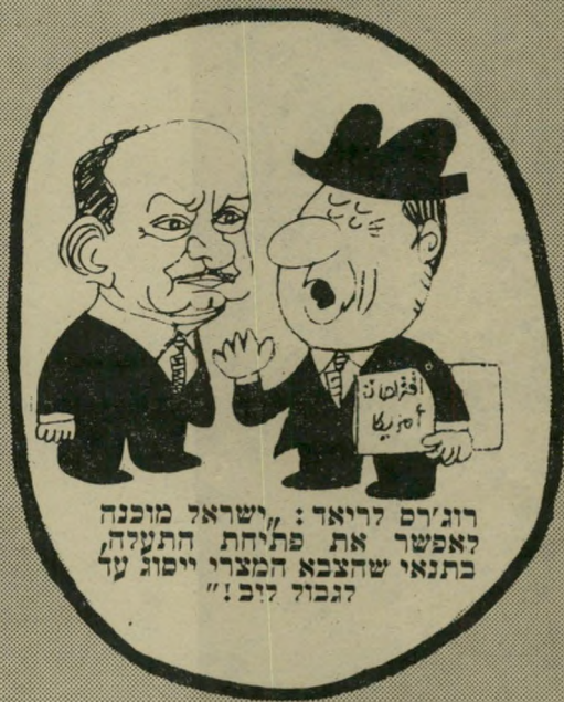
רוג'רס לריאד: "ישראל מוכנה לאפשר את פתיחת התעלה, בתנאי שהצבא המצרי ייסוג עד לגבול לזב!"