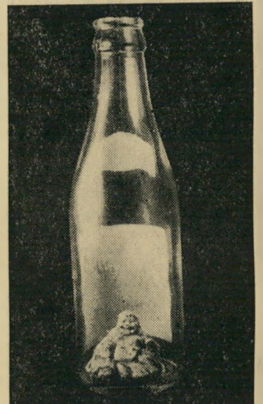
בודאה בבקבוק של מלכה — גיין מחוץ לבקבוק

היו לו כמה פאטנטים בלעדיים משלו. כך, למשל, טען כי הוא מסוגל להכניס פסל של