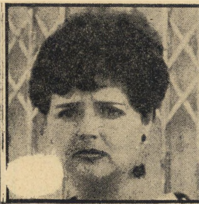
מזכירה יהודית בן-ישראל