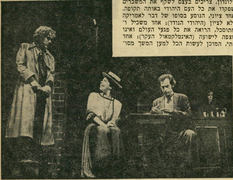
הציוני, הסוציאליסטית והאינטלקטואל ב"מעבר לגבולות"

קורותיה של משפחה שהיגרה מגליציה ללונדון, צריכים בעצם לשקף את המשברים שפקדו את כל העם היהודי באותה תקופה. אחד ציוני, הנוסע בסופו של דבר לאמריקה ולא לציון (היהודי הנודד); אחד משכיל ו- מתוסכל, הרואה את כל פגעי העולם ואינו מצפה לישיבה (האינטלקטואל העקר); אחד דתי, המוכן לעשות הכל למען המשך מסר-