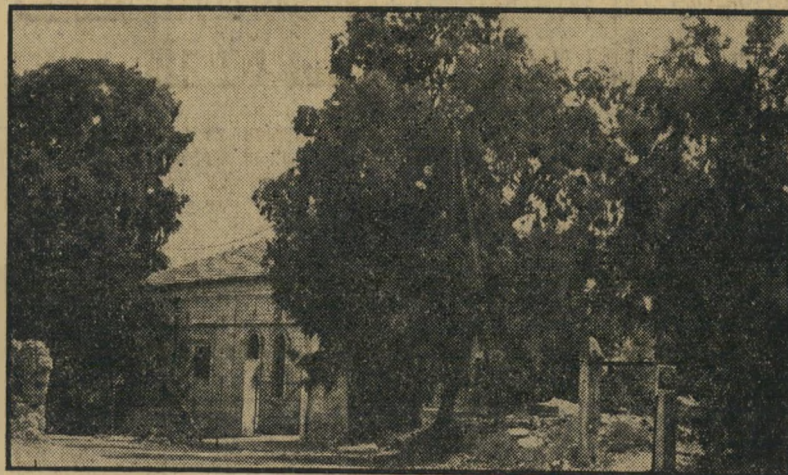
בית-הספר היסודי הממלכתי א' של לוד, אשר היה בית-ספר יסודי גם בימי המנדט הבריטי. עתה לומדים בו תלמידיים יהודים וערביים גם יחד, בכיתות מעורבות. בלוד גרים כיום כמה אלפי ערביים.

אשר בו נודנו פידאין כה רבים למאסר על פעולות-החבלה שביצעו בשליחותו של ד"ר ג'ורג' חבש.