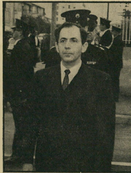
שר-משטרה שלמה הילל

ולא רק הלילה. פשע מוזעזז זה קרה גם אתמול בלילה, ושלשום, ובכל הלילות ש-לסניהם. ומה שגרוע יותר - הוא ימשיך להתרחש, מדי לילה. עד מתי - אין יודע. לא אירגון פשע מיסטורי, המספק קורבנות תמימים לסוטימין, אשם בזוהעה זו. החלק האימנטי ביותר בפרשה הוא, כי ה-