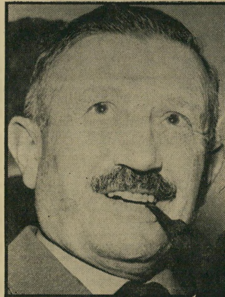
נציב אריה ניר