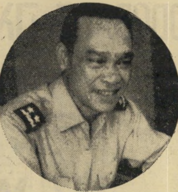
מבצע הפיכה גנרל זון נור

אלו, כאשר הוא מוציא מויאטנאם 150 אלף חיילים אמריקאים נוספים. ייתכן ששיקול זה יפעל וייתכן שלא. אולם אפילו יחליט ניקסון להתעלם מדעת הקהל האמריקאית, העויינת כל התערבות צבאית חדשה, ספק אם הסינאט האמריקאי יאפשר לו לפעול.