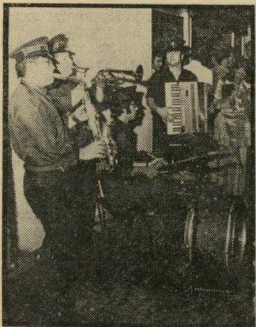
תזמורת מועדון "עינבר" איזה אורקסטרה

— כמו ששוחררו החשודים השונים בעשר הצעות של דיסקוטקים אחרים בעבר. אורחי הכבוד בפתיחת עינבר היו צוות