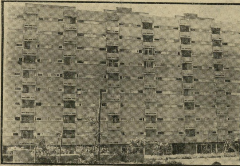
רבייהקומות ברחוב אלי כהן בבתיים הצינורות התפוצצו

מייד לאחר שנכנסו לדירותיהם, גילו מאה הדיירים החודשים שהם נכנסו לבוץ עמוק: