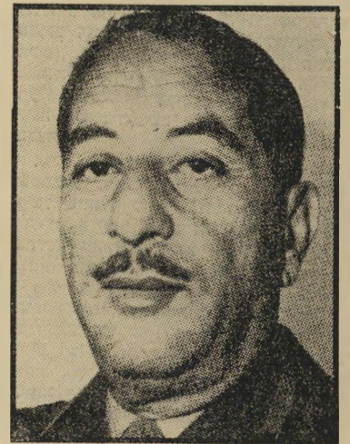
נשיא אחמד אל-אביכר היהודי נתלה על המאוורר

עוצרים את מי שרוצים. חיי היום-יום בעיראק אופיי פחד. מלבד שוטרי-תנועה, אין שוטרים ברחוב. במקומם סורי-