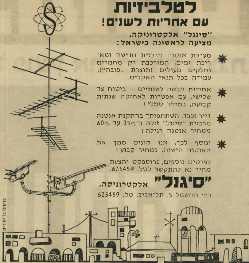
ניסוח ג' תל-אביב

"סיגנל" אלקטרוניקה, רח' החשמל 5, תל-אביב, טל. 625459