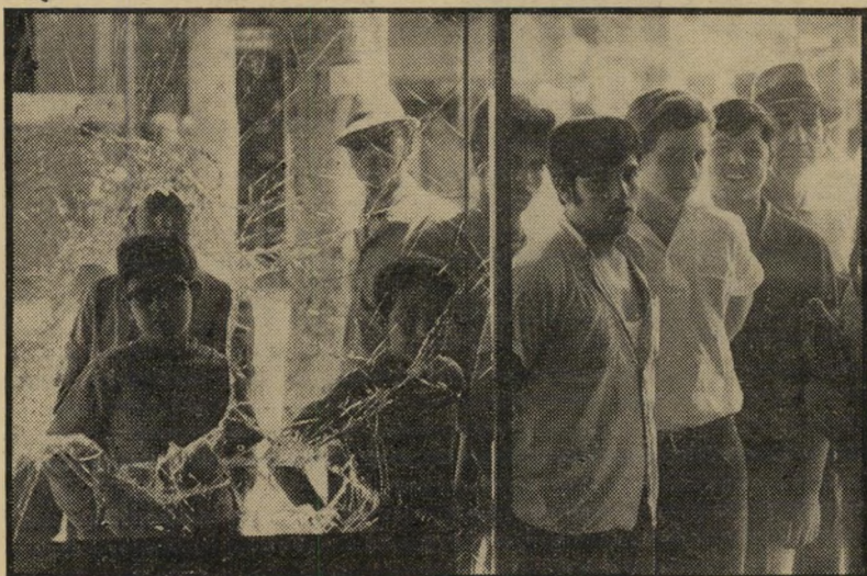
הסקרנים חזנות השודדה, בבן־יהודה 41, תל־אביב, הפכה לאטרקציה לשכנים ו"סובריאור", שהתבוננו בהרס שהותירו השוודים: בתמונה למעלה: מנהל החנות נראה מבעד לחור שנופרץ בשמשת־הביטחון של חלון־הראווה. שנובוייה 12 סנטימטר.