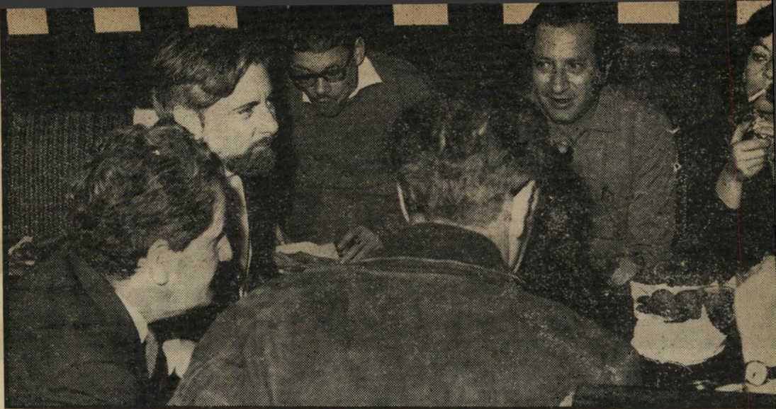
אורי סלע, שרגא הרגיל ואלכס מסיס בשיחה עם אורי אבנרי ועמנואל פרת

אולי זוהי אחת הסיבות להפכה שהתחוללה בעיתונות הישראלית בעשור האחרון, אחרי שיוצאי העולם הזה תפסו עמדות-מפתח בעיתונים אחרים, והעבירו את אסכולת העולם הזה לכל פינות העיתונות הישראלית.