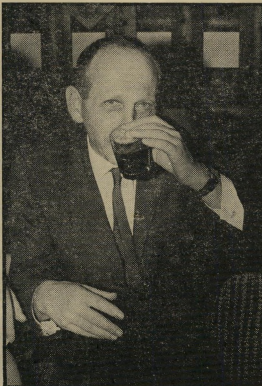
כתב "הארץ" רן כסלו