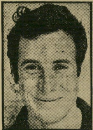
יורם שדה (1970)