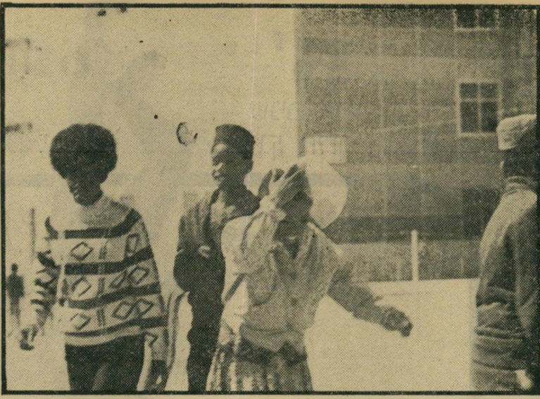
אחדים מילדי העולים הכושים בחצר בית- הספר רביבים בדימונה, בו הם לומדים. ידעת עברית, הריהם מצטיינים בלימודים. למרות שהילדים החלו את לימודיהם ללא

הם עלו לישראל — והעמידו אותה ב- פני בעיה קשה. היחידים שאינם מתרגשים, בכל הי- מצב העדין הזה, הם העולים החדשים עצמם. הם שולחים לחו"ל מכתבים מלאי- התלהבות על מצבם וארצם החדשה. הם קונים רק מאכלים טובים — נקניק, דבש, מצות לשבת. משלמים מצויין, לא נשארים חייבים, מספר אריה שמרליק, שנוסף ל-