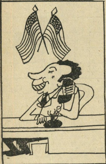
"בקשר לביקור פומפידו... להזמין דחוף יבוא חדש של עגבניות ישראליות!" (קאנאר אנשנה, פאריס)