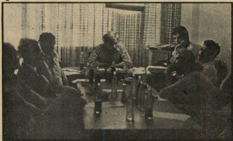
יום העיון במערכת „העולם הזה“

מטבעו, אין דיון מסוג זה מסתיים בשורה של החלטות פסקניות, המתבצעות כולן בן-לילה. מה שהישיבה הארוכה גיבשה היא המערכת כוללת ומחודשת של העולם הזה, והנחיות שידריכו את החישובים שהוחלט עליהם ישתקפו בעתון רק בהדרגה. כמה