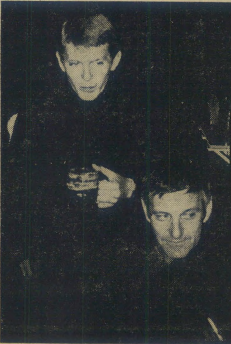
טייטים בפאב "אוויה"

מישהו מהאורחים, אלא הארב אדאמס, דוג-מן מיקצועי לאומנת-גברים, שריחף על ה- מסלול באצילות אלגנטית ובטבעיות מעו-רת קינאה, הוא נראה כאלו גולד שם, על המסלול, לבוש בחליפה אנגלית וכובע