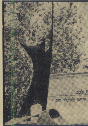
האנדרטה בחדרה והגבולות ישונו. יותר מדי אנשים הלכו למות...