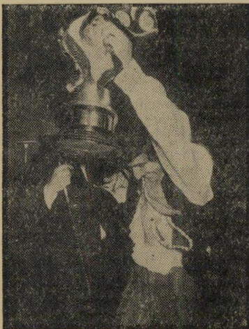
הגביע הוא של "מוני"

אפילו תוכניות החבלה של אליפתח לא הצליחו למנוע את קיום פסטיבאל-הקצב ה' גדול, שנערך בשבוע שעבר בירושלים. שעה קלה לפני ההתכוננת עמדה להתחיל — כא' שר באולם התקבצו כאלף צופים ועוד חמשת מאות נותרו בחוץ — נכנסו חוליות שוטרים לחדרי ההלבשה של הלהקות, והורו לכולם לצאת החוצה לבידיקה.