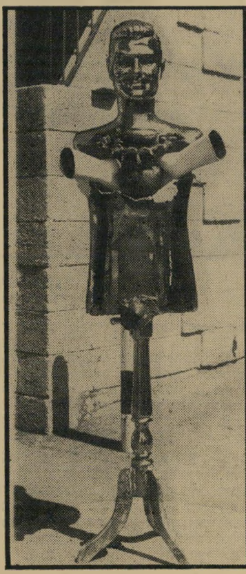
"ד"ר לוי" של תומרקין

לציור המודרני. את הציורים רואים בתנאי תאורה מצויינים. ★ בגלריה צ'מרנסקי מוצגת תערוכתו של הצייר רב בוסני . יש שם אוסף של ציורים, בחלקם קיטש וחלקם השני, ציורי הנוף, הם בעלי צבעוניות מעניינת.