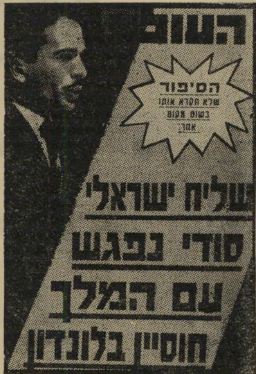
שער "העולם הזה" (1626)

לסיפור עצמו, שהופיע בתוך הגליון, ניתנה ההקדמה הבאה: "זהו סיפור דמיוני לחלוטין, למרות שכל גיבוריו אינם דמיוניים כלל. הוא בא לענות על השאלה שכל איש שואל את עצמו בלי הרף: מה היה קורה אילו היתה אפשרות פגישה בין לוי אשכול לבין חוסיין?"