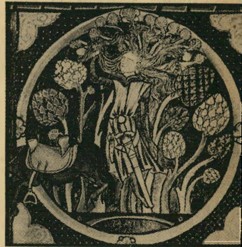
אבשלום נתפס בעץ על חוט השערה

„האם זה יקרה שוב? ... האם דגל ה- מהפכה הבאה יהיה עשוי מתלת-שיער? ואם כן, האם זה יהיה, כרעמתו של שמשון,