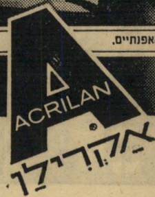
ב.אקרילין אני סרטישה חסיד רכה ונשית. בנדי. אקרילין נעיסים. סלפסים ומחסימים לגורתי בעיצובם הסיוחד ובצבעיהם האפתיים.