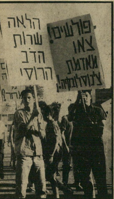
סטודנטים מפגנים בתל-אביב החרות — אחת היא