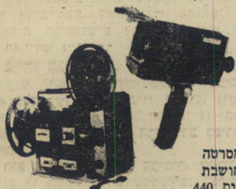
מסרטה חושבת דגם 440

מקרנה דגם 456 סרט אוטומטית לסרטי 8 מ"מ וסופר 8