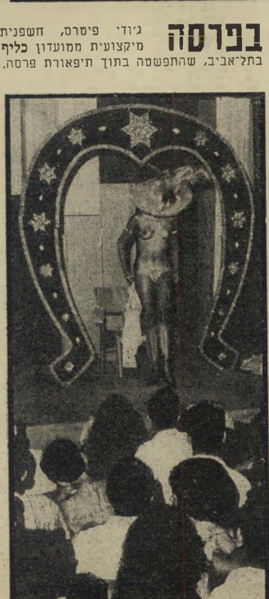
בפרסה גידי פירסט, חשפנית מיקצועית ממועדון כליף בתל-אביב, שהתפשטה בתוך תיפאורת פרסה.