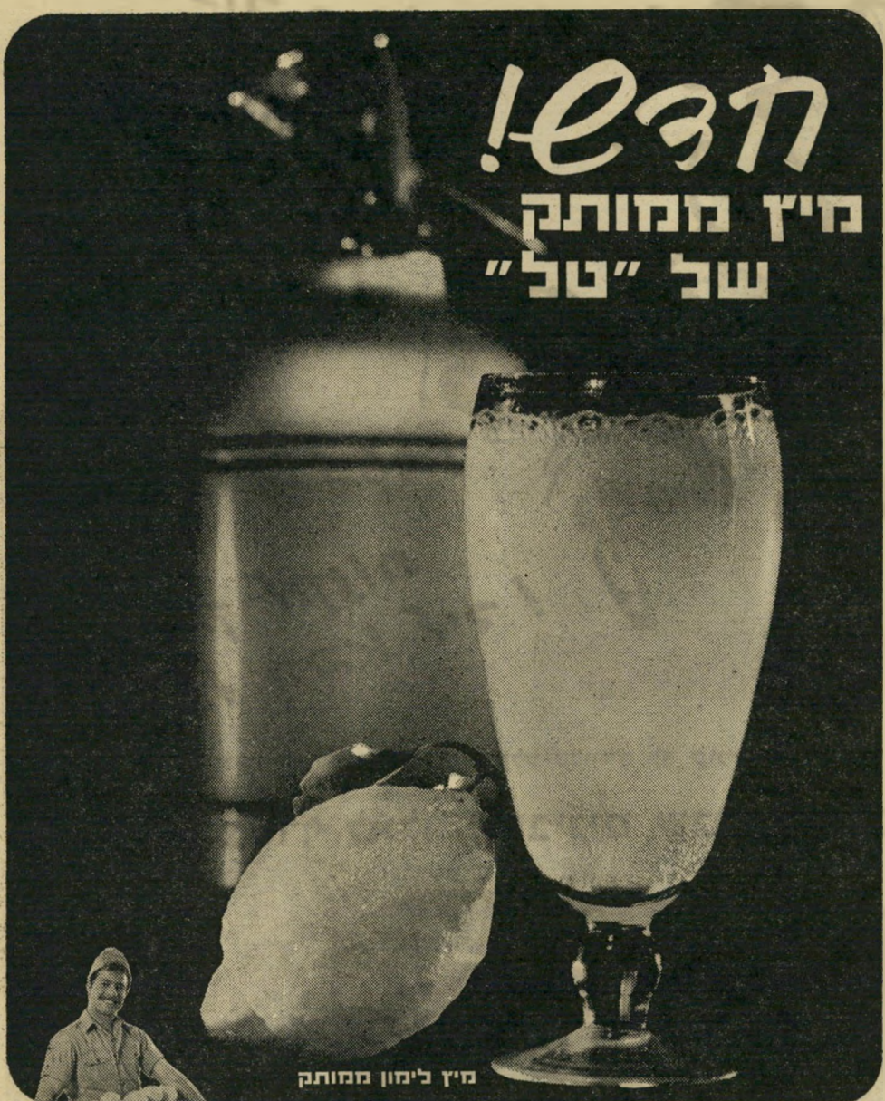
מיץ לימון ממותק