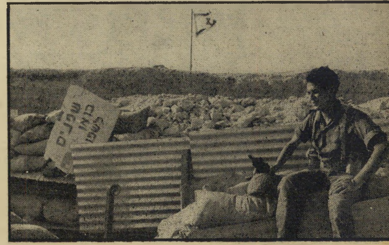
שרות אקדמאי טוראי צבי טרופ, כלכלן-חקלאי בחייו האזרחיים, על מוצב-צה"ל ליד גשר-דומיה. לידו משמאל, אחד הש-לטים ההיחוליים הממלאים את מוצב-צה"ל לאורך הירדן, האומר: "שפנינו, בואו לשפניהו"