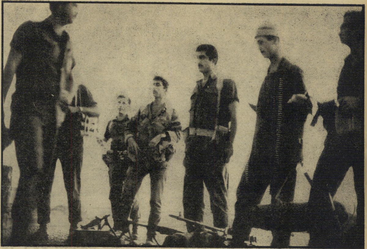
יצאים למארב יחידת צה"ל, המחזיקה באחד המוצבים ליד גשר-דומיה, מת-כוננת ליציאה למארב לילי נגד חוליית-החבלנים החוצות את הגבול. המפקד (משמאל) בודק את אנשיו ואת ציודם לפני שיצאו לשכב במארב הנמשך עד אור הבוקר. בתמונה משמאל נראה אחד החיילים בעמדה באחד המוצבים הנמצא על גדות הירדן.

תורנות המטבח או הכנת הארוחות היא פולחן בסני עצמו. המוצבים הקדימיים של צה"ל זוכים בלוח מזון גבוה ביותר. יש