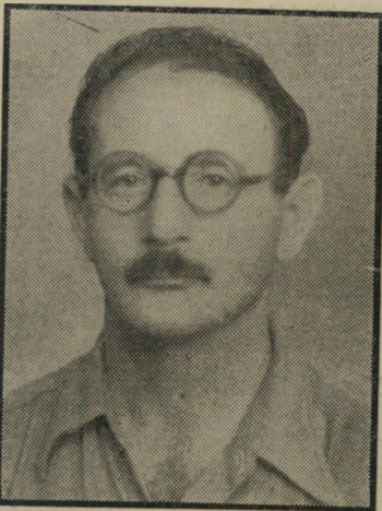
נפגע וינדהולץ — לפני, לא ידעתי שמרמים —

שני חיילים גדרו אותו. ובכן כך ניראה עריק ריאקציונר, היורה הלמוט. עריק ריאקציונר משוגע. צריך להיות משוגע כדי לנסות לעבור חומה כזו. אין לו שום סיכוי נגד האלקטרוניקה.