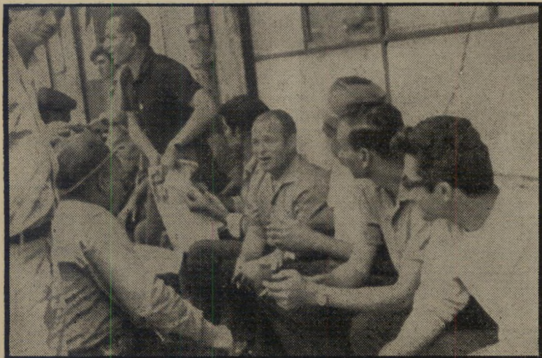
שוכתי מלמשת חוצ'נר „אני אוהב לשבור!“