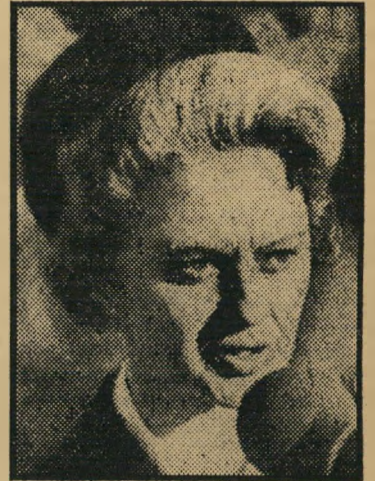
מושלת וואלאס "שתשתוקו"

היא היתה אשה שקטה, ומעולם לא התיימרה להיות אלא מה שהיתה: אמצעי,