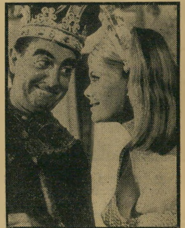
אושאה זרמות-חלומות ב"יוליסס" המון גטרות מילוליות

בקשי מכשירי בישול רק בחברת פזגו המציעה מבחר עשיר, ממנו תוכלי לבחור את המכשיר לפי תקציבך וטעמך האישי. בקשי מכשיר רק בחברת פזגו המצטיינת בשרות טוב ואספקת גז סדירה. זכרי שחברת פזגו מעניקה הנחה מיוחדת לזוגות נשאים! חברת פזגו מציעה לנשאים עד ל"ג בעומר מכשירים משוכללים במחירים מיוחדים!