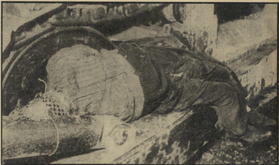
כפי שנתגלה על-ידי חוקרי ה-טראקטור, כשעיניו מכוסות בכפייה המנומרת שלו, וחבל המהודק משטרה: הוא נראה קשור ל-בחזקה סביב צווארו וזרועו - קשור למנוף של הטרקטור.

לגמרי סיים את ביקורו בדמשק וחי-זר לירושלים. איתו הביא 2500 דינאר,