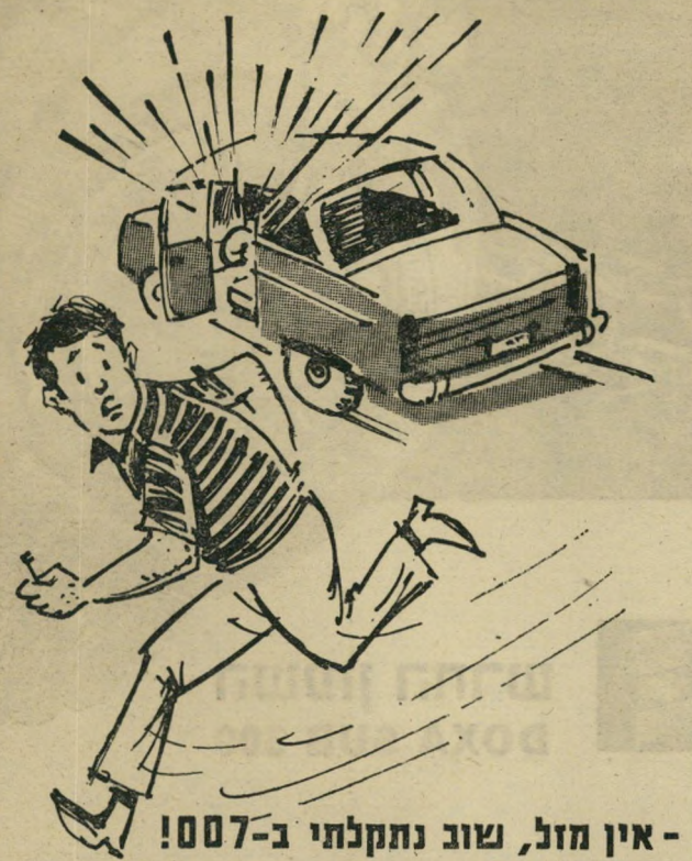
- אין מזל, שוב נתקלתי ב-007!

המכשיר האלקטרוני 007 מונע גניבת מכוניתך!! אי-אפשר להתניע את המכונית או לפתוח את מכסה המנוע, כאשר 007 נמצא במצב "שמירה". 007 הוא המכשיר ההכרחי לשמירת כל מכונית!