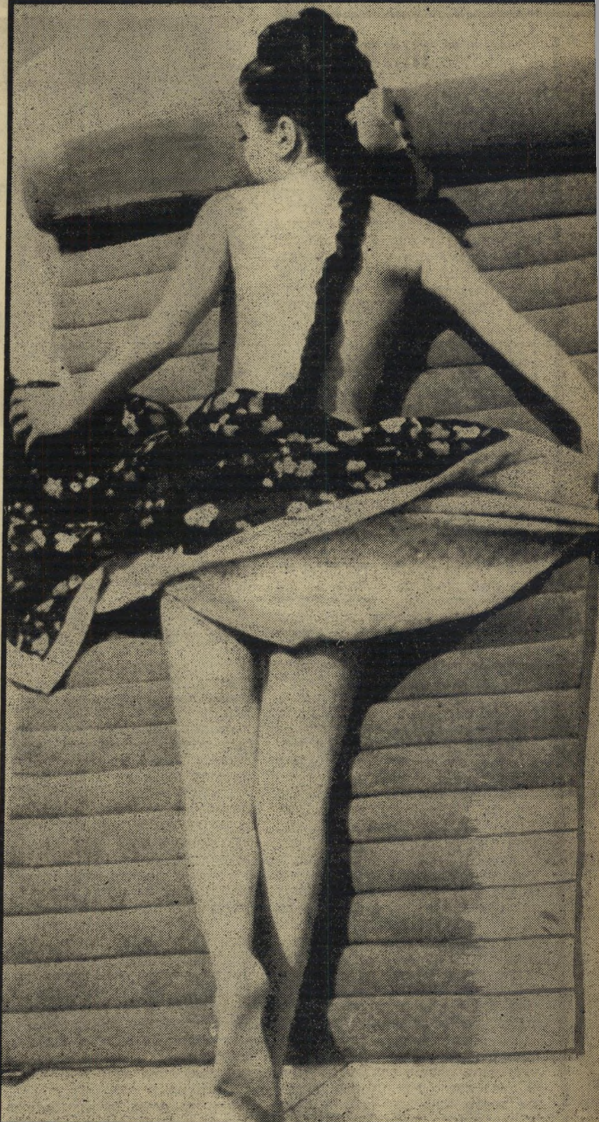
הפקת טרט סלבידי בסרט משחקים רומיים, כשרומינה בייתה רומינה על חוף ים של הרצליה. את הידיה שחי הכירה רומינה בעת

וכינה פאואר, בתו של סירון פאואר, ועמה מאד על במאי הטלוויזיה שלה: "אם אתה רוצה זונה תיקח לך אחת מהרוב, לא אותי" והיא בסח יודעת מה שהיא אומרת, למרות שהיא ילדה קטנה מאד, רק בת חמש-עשרה. אם כי רומינה פאואר הספיקה במשך חמש-עשרה שנות חייה לעשות יותר סקני דלים בינלאומיים מאשר אמה, לינדה כריס-טיאן, אומרים שאת כל הסקנדלים הללו ביימה האמא שלה.