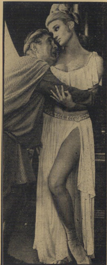
מוסטל ב"הרומאים באים" זונה נאמנה

הציד החייתי קישר אותה בחבל וסיתב אותה ליער, לבקתה בה הוא חי. ואז מתברר שזה עומד דווקא להיות סרט על יחסים הנקשרים אסאט בין הציד