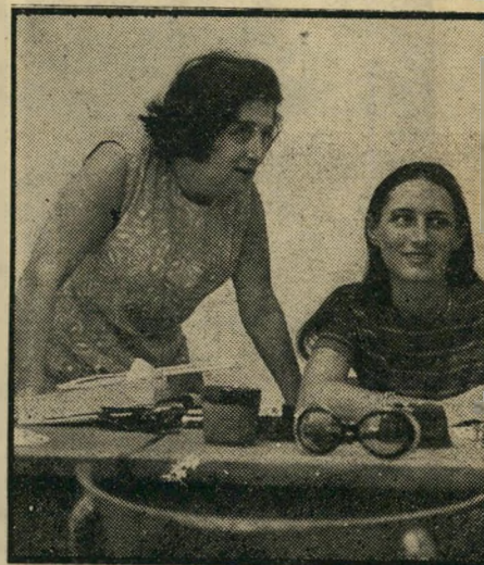
עם אמא שדאגה לכל, כולל טבעת-נישואין מיר, חדת, מזהב לבן, מעשה-ידי צורפי משכית.

מ זכרונות שמכחינות יחסים, זוהי קפיצת דרך גדולה. כי המלחמה מעמידה בפרור פורציה את הדברים. דברים שהיו חשובים קודם מאבדים את חשיבותם. כי המלחמה מבודדת נורא. האדם יכול להיות מוקף גידור של חברים, אבל הוא נשאר אדם, עם מחשבותיו הטובות והרעות, לגמרי לבד. ואז כשמוצאים אדם שני, יש לזה יותר חוק. כרוך שסוגי-חיים אחד נגמר אצלי, ויחל סוג חיים חדש. לא עברתי שום היסטוריה ופחד של ויתור על סיגנון-חיים קודם. אני לא מתחרטת על אף רגע שחייתי במסגרות חיים אחרות. אני לא הפסדתי זמן. כל הדברים שעשיתי תרמו לי והעשירו אותי. הכרתי אותו בשבטה. זה היה שבועיים לפני פרוץ המלחמה. אף פעם קודם לכן לא עמדתי להתחתן. תמיד אמרתי: כשזה יקרה, זה יקרה. היה לי חבר וידיד שמונה שנים, הבמאי מיכאל קקויאניס. הכרתי אותו ב-פסטיבל בקאן בשנת חמישים ותשע. כל שנה הייתי נוסעת אליו, ליוון, לכמה