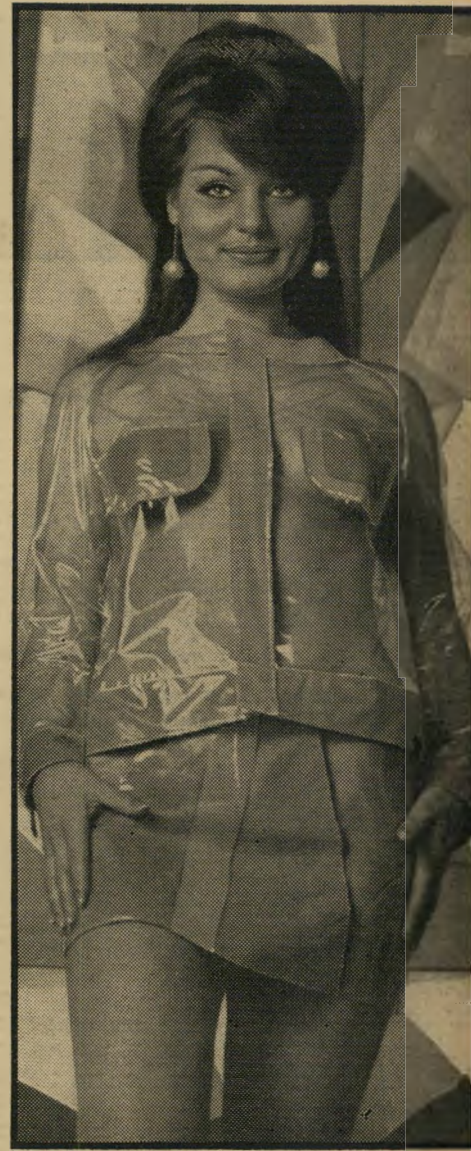
החורף בעיצומו, אך השבוע פורר סמה כבר אפנת העתיד של החורפים הבאים: יותר קצר, יותר שקוף.