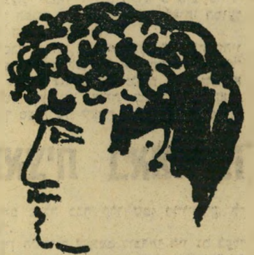
משורר בן־יהודה (בציור עצמו) יום כן, שלושה לא

בין פושק־השפתיים . 35 שירי תיק־ וה הם שירים מובנים וענייניים, בדיוק כמו מחברים. כשיש לו שלושה פרחים, הוא נותן