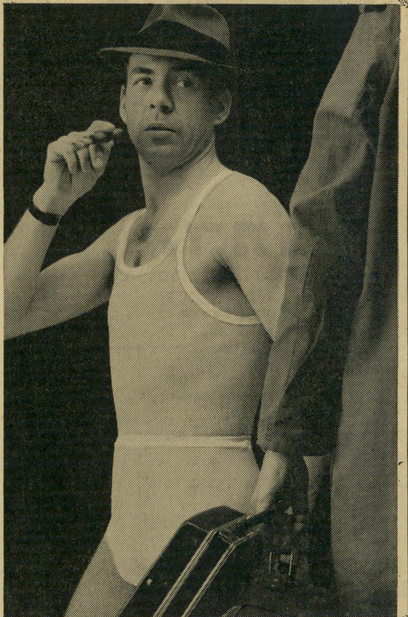
שחם לבניסון אילון

חופי בן-לון מיוצרים ע"י הברלון בע"מ ישראל ברשותה הבלעדית של חברת יוסף בוקרופט ובניו בע"מ, ארה"ב