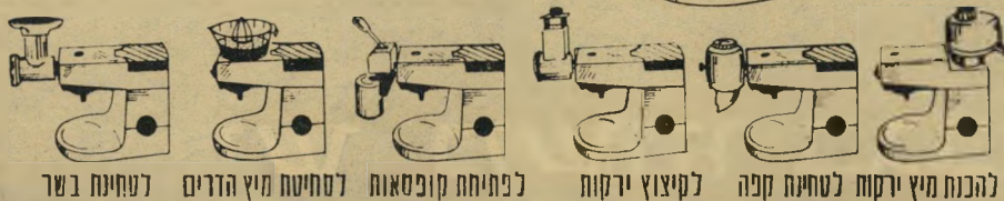
להכנת מיץ ירקוח לטחינת קפה לקיצוץ ירקות לכתיתה קופסאות לסחיטת מיץ הדרים לטחינת בשר