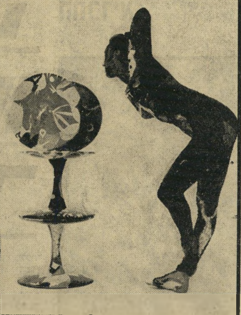
מרים בת'יוסף (באמצע) אשה מצויירת וצ'לו מצוייר